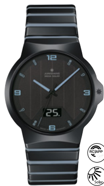
Force Mega Solar 18/1400.44