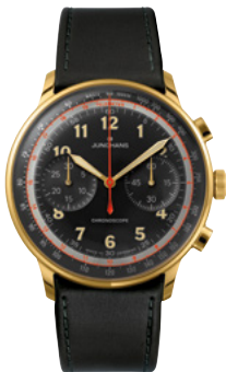
Telemeter Edition JF 27/3480.02