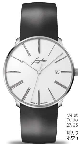
Meister fein Automatic Edition Erhard 27/9300.00 18カラット ホワイトゴールド