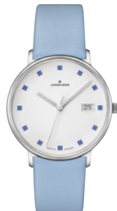
FORM Damen 47/4055.00