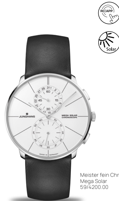
Meister feyn Chronoscope Mega Solar 59/4200.00

ユンハンス多周 波電波式ソーラームーブメント J110 | ストップウォッチ機能 | 永久カレンダー | 最大3年のパワーリザーブ | ステンレススチールまたはPVD加工のケース 直径39.5 mm | サファイアクリスタル | 防水5気圧