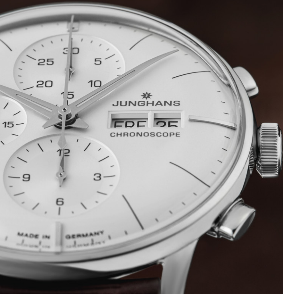
Meister Chronoscope 27/4120.02