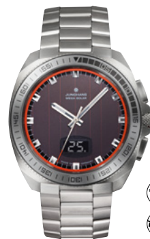
1972 Mega Solar 56/4211.44