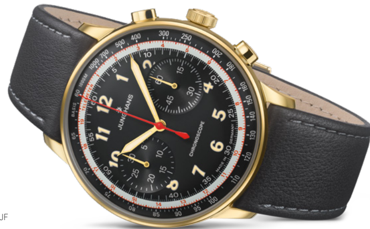
Telemeter Edition JF 27/3480.02

計器時計としてのテレメーターは、1950年代には主にスチール製ケースで作られていました。150本限定のTelemeter Edition JF（写真右）は、ユンハンスのハネス・シュタイム取締役が、亡き友人の遺族から譲り受けた希少なGoldモデル（左）を模範としています。