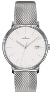
FORM Damen 47/4851.44