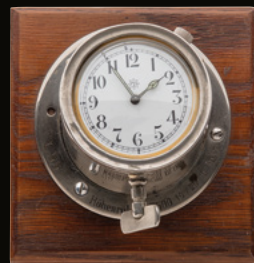
1917 高度7600メートルの記録を達成した飛行船の機内時計

空を飛ぶことに、ユンハンスは前々から特別に魅了されてきました。だから航空が時間計測と歴史的に密接に結びついていることは不思議ではありません。すでに1930年代にユンハンスは航空機や飛行船向けに、飛行時間を算出することができる機内時計を生産していました。1950年代には新設されたドイツ連邦国防軍向けに、今日では伝説的になったパイロット用クロノグラフを開発しました。ユンハンス・コレクションの最新のPilotモデルもまた、この伝統を汲んでいます。