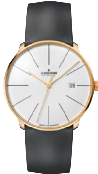
Meister fein Automatic 27/7150.00