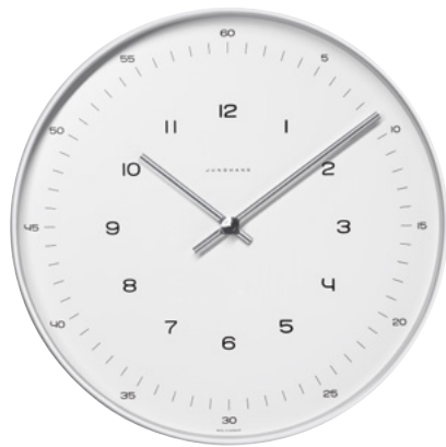
max bill Wanduhr Ø 30 cm radio-controlled (EU) 374/7001.00 quartz 367/6047.00