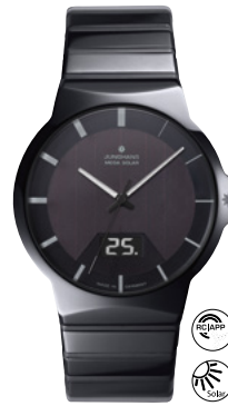
Force Mega Solar 18/1133.44