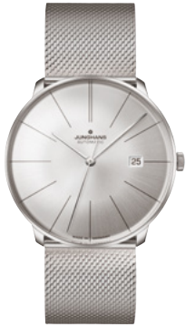
Meister fein Automatic 27/4153.44