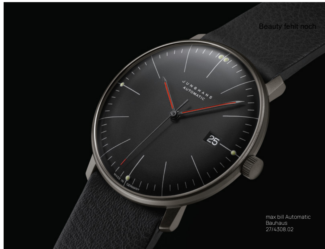
自動巻ムーブメント J800.1 | ブラックPVD加工ステンレススチール製ケース 直径 38.0 mm | サファイアクリスタル バウハウスのモチーフが入ったシースルーバック | 防水5気圧