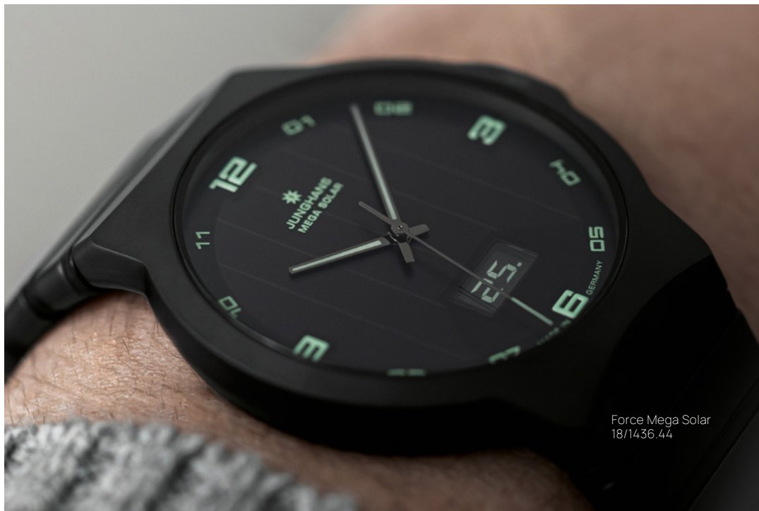
Force Mega Solar 18/1436.44

電波式腕時計のパイオニアとしてと定評があるユン ハンスのこの7テクノロジーは1990年のMEGA 1発表以来、コレクションに欠かせないものとなっています。電波式腕時計の時刻表示は今日でもなお最高の精度を保っています。だからこそこのタイムピースは、人生のあらゆる局面で頼りになるパートナーなのです。