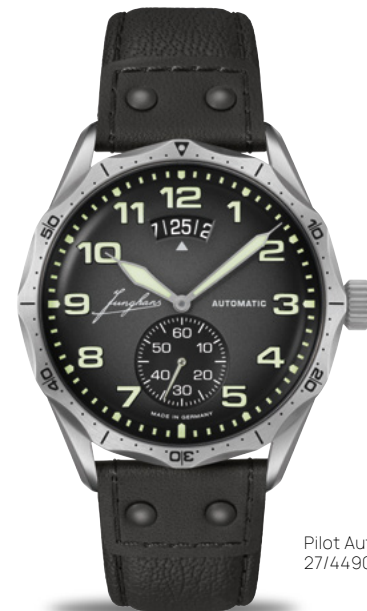
Pilot Automatic 27/4490.00

ステンレススチールケース 直径43.3 mm |両方向回転式ベゼル |サファイアクリスタル |防水10気圧 Pilot Chronoscope : 自動巻ムーブメント J880.4 |ストップウォッチ機能 Pilot Automatic : 自動巻ムーブメント J800.1.6