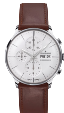
Meister Chronoscope 2714120.02