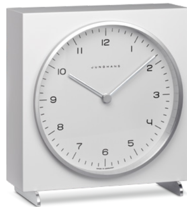
max bill Tischuhr radio-controlled (EU) 383/2200.00 quartz 363/2210.00