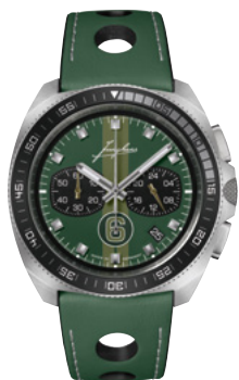
1972 Chronoscope Sports Edition 2024 41/4467.00