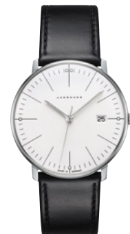
max bill Quarz 41/4817.02