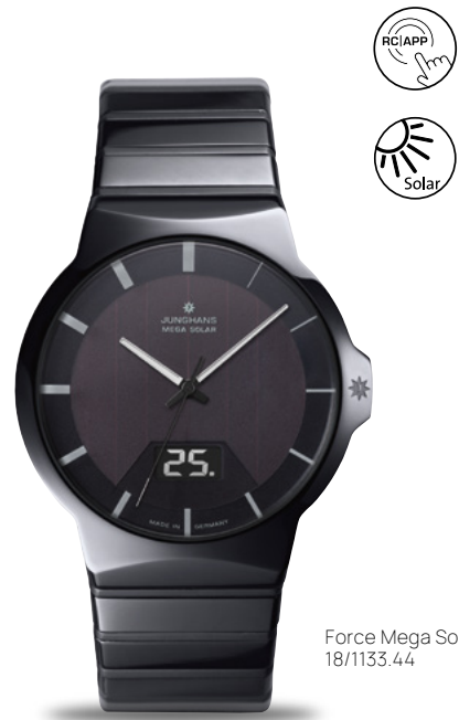
Force Mega Solar 18/1133.44

電波式腕時計のパイオニアとしてと定評があるユン ハンスのこの7テクノロジーは1990年のMEGA 1発表以来、コレクションに欠かせないものとなっています。電波式腕時計の時刻表示は今日でもなお最高の精度を保っています。だからこそこのタイムピースは、人生のあらゆる局面で頼りになるパートナーなのです。