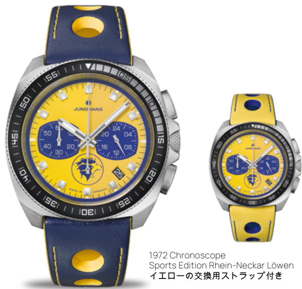
1972 Chronoscope Sports Edition Rhein-Neckar Löwen イエローの交換用ストラップ付き

クォーツムーブメント J645.83 | ストップウォッチ機能 | ステンレススチールケース 直径43.3 mm | 回転式ベゼル | Edition刻印入りケースバック | サファイアクリスタル | 防水10気圧