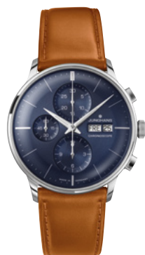
Meister Chronoscope 2714526.02