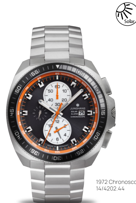
1972 Chronoscope Solar 14/4202.44

1970年代のデザインは今日でもその魅力を失っていません。ソーラーエネルギー駆動の1972モデルがそのことを証明しています。特徴的なフラット形状のケース、人目を引くオレンジのアクセント、ダイアルに見られる独特の正方形のアプリケ、そしてスポーティーな全体の印象。