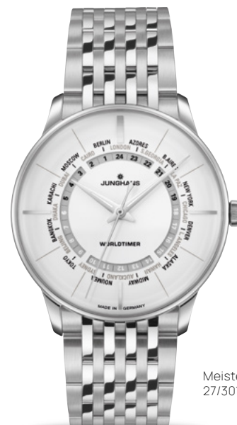
Meister Worldtimer 27/3011.45

匠で気品にあふれたタイマーは世界のたゆまぬ動きを映し出します。時計ダイヤルには同時に24箇所の時間が表示されます。Meister Worldtimerで想起するのはたとえ異なるタイムゾーンにいても瞬時に二ヶ国の時間が分かることです。