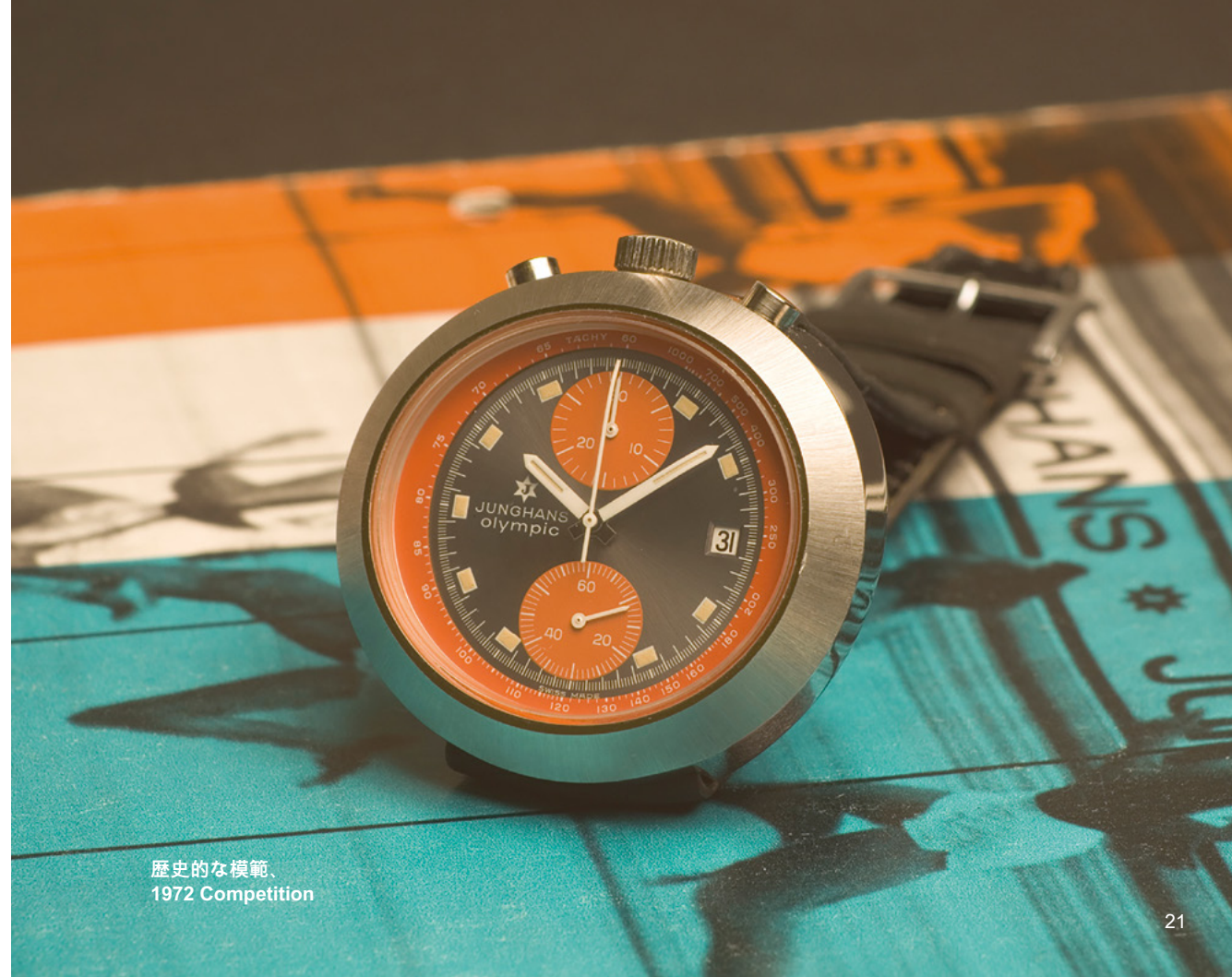
歴史的な模範。 1972 Competition