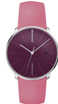
Meister fein Automatic 27/4358.00