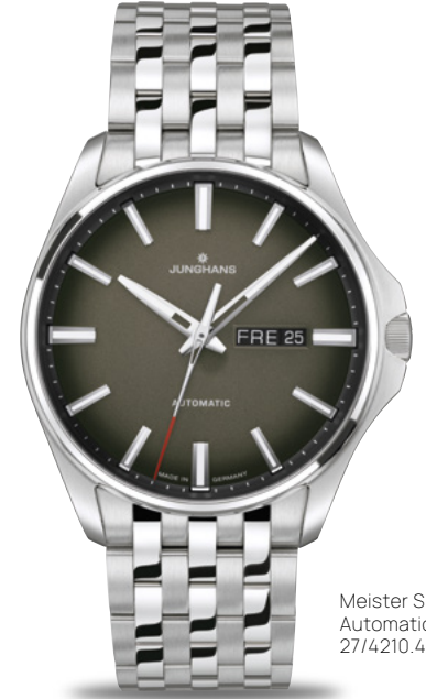
Meister S Automatic 2714210.44