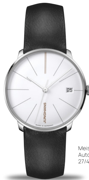
Meister fein Kleine Automatic 27/4230.00