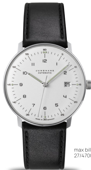
max bill Automatic 27/4700.02