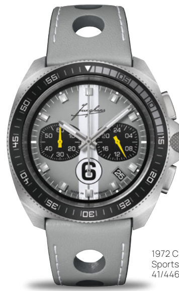
1972 Chronoscope Sports Edition 2024 4114468.00

クォーツムーブメント J645.83 | ストップウォッチ機能 | ステンレススチールケース 直径43.3 mm | 回転式ベゼル | サファイアクリスタル | 防水10気圧 | 各200本限定