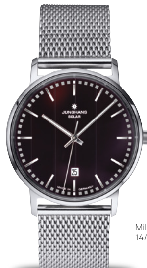
Milano Solar 14/4061.44