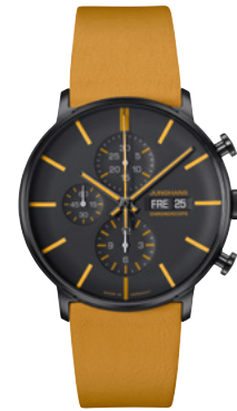
FORM A Chronoscope 27/4372.00