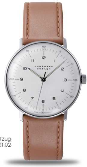
max bill Handaufzug 27/3701.02

Original max bill腕時計： 時が過ぎても、優れたデザインは古びません。