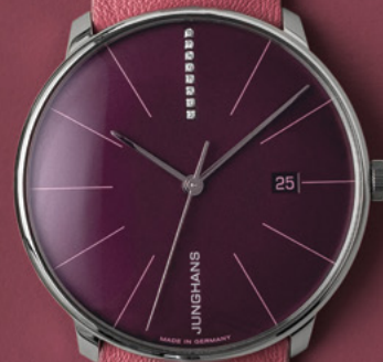
Meister fein Automatic 2714358.00