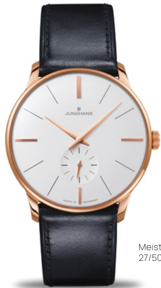
Meister Handaufzug 27/5002.02

エレガントなデザインと精密な機械のスタイリッシュなコンビネーション：ローズゴールドカラーのケースとマット仕上げシルバーのダイヤルが微妙に絡み合って、このモデルのクラシックな表情を暖かいトーンで輝かせています。