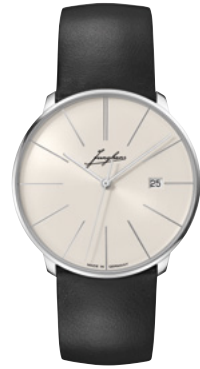
Meister fein Automatic Signatur 27/4355.00