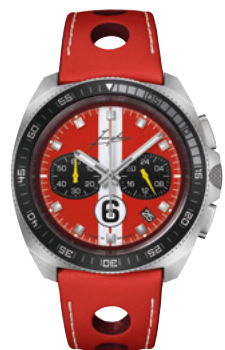
1972 Chronoscope Sports Edition 2024 41/4466.00