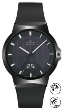
Force Mega Solar 18/1000.00