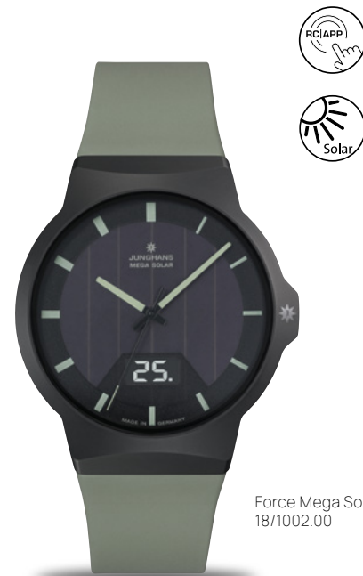
Force Mega Solar 18/1002.00

Force Mega Solarは、快適な着用感とクールさを兼ね備え、非常に実用的です。このことが、読み取りやすいビッグデイト、環境にやさしいルミナス加工を施した針と数字などによって引き立てられ、合成ゴムのストgラップのカラーともマッチしています。