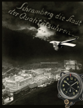
1930年代 当時のユンハンスの機内時計と広告モチーフ