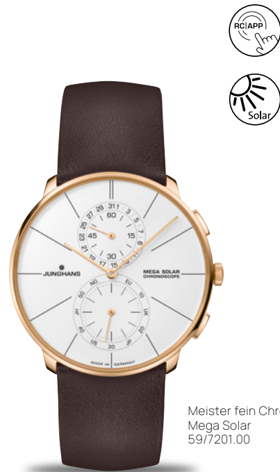
Meister feyn Chronoscope Mega Solar 59/7201.00

繊細なデザイン、連動型電波式ムーブメントで精確に時を刻む、持続的なソーラーエネルギーによる駆動、実用的なストップウォッチ機能、複雑なテクノロジー機構にも関わらず操作が容易などMeister feyn Chronoscope Mega Solarは様々な素晴らしい特性を融合しています。