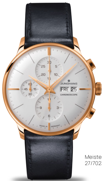
Meister Chronoscope 27/7023.02