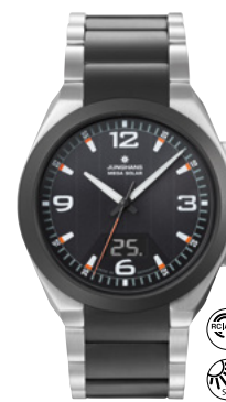
Spektrum Mega Solar 18/1425.44