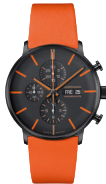
FORM A Chronoscope 27/4370.00