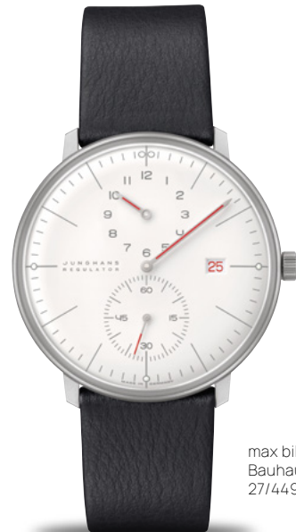
max bill Regulator Bauhaus 2714493.02