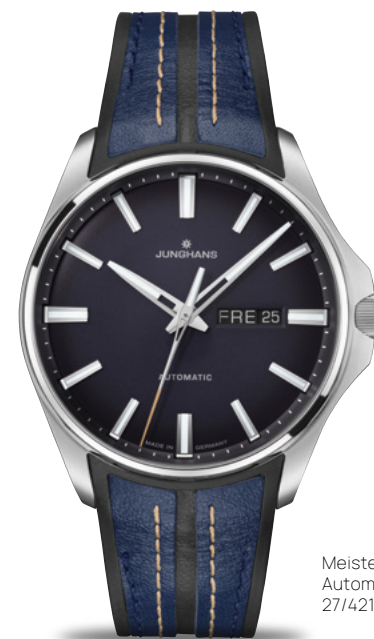
Meister S Automatic 2714211.00

Meister S Chronoscope 自動巻ムーブメント J880.1 | ストップウォッチ機能 | ステンレススチールケース 直径45.0 mm | ネジ込み式クラウン Meister S Automatic : 自動巻ムーブメント J800.4 | ステンレススチールケース 直径44.2 mm | ネジ込み式クラウン