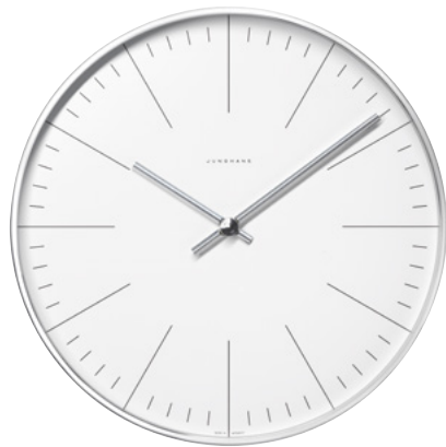
max bill Wanduhr Ø 30 cm radio-controlled (EU) 374/7000.00 quartz 367/6046.00