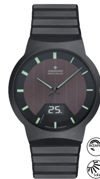
Force Mega Solar 18/1938.44