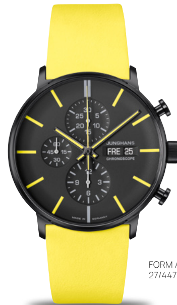
FORM A Chronoscope 2714473.00