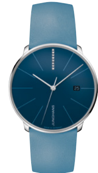
Meister fein Automatic 27/4356.00