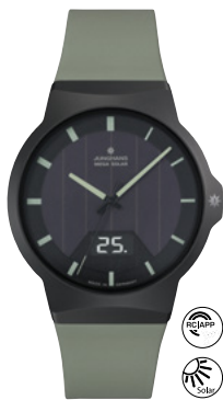
Force Mega Solar 18/1002.00