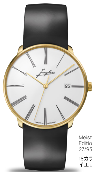
Meister fein Automatic Edition Erhard 27/9301.00 18カラット イエローゴールド