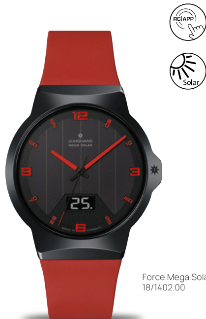
Force Mega Solar 18/1402.00