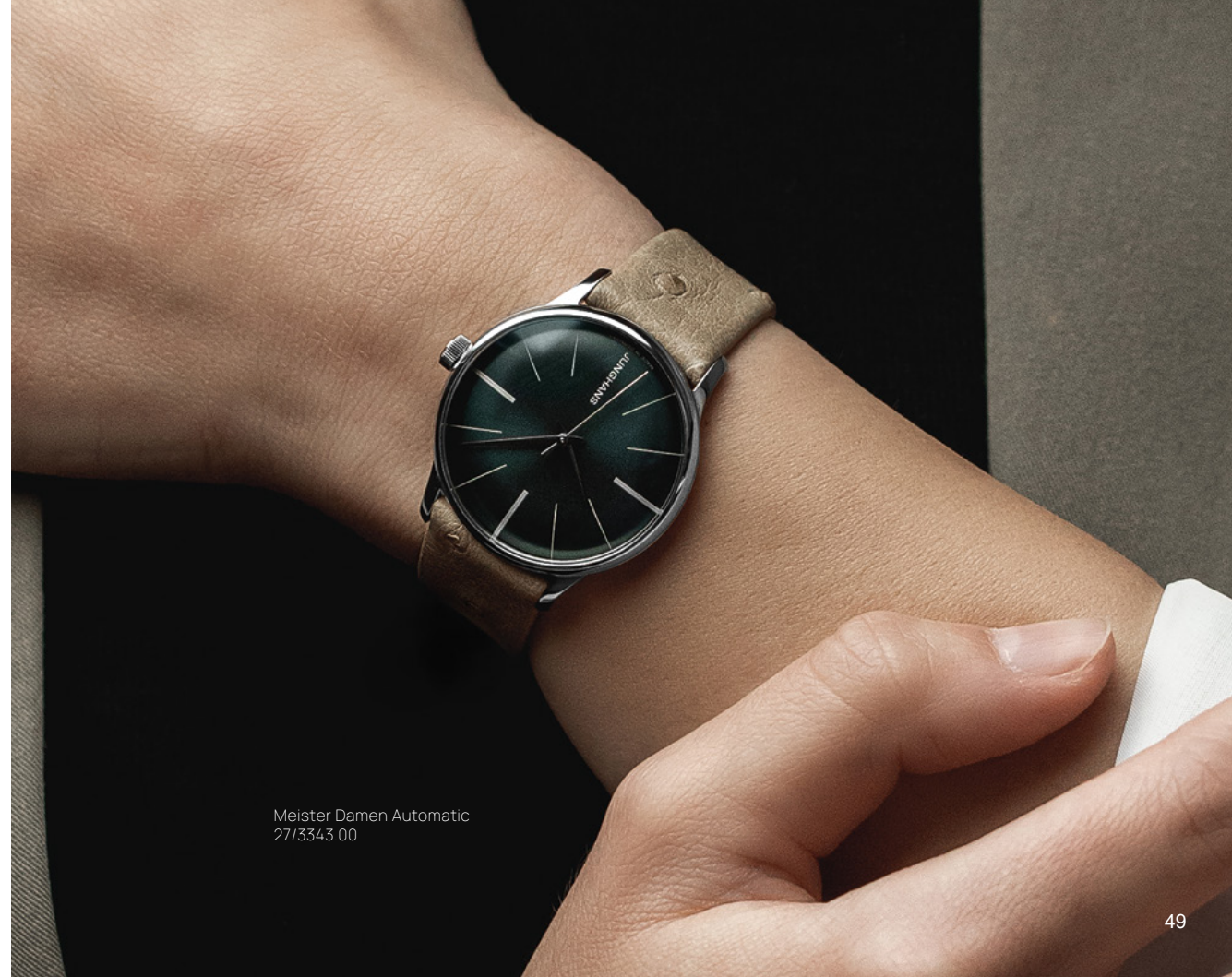
Meister Damen Automatic 2713343.00

Meister Damen Automatic : 自動巻ムーブメント J840.1 | ケース 直径33.1 mm