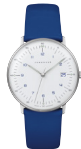
max bill Damen 47/4540.02