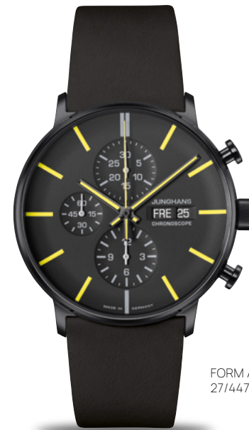
FORM A Chronoscope 2714473.02

自動巻ムーブメント J880.1 | ストップウォッチ機能 | PVD加工ステンレススチールのケース 直径42.0 mm | サファイアクリスタル | タイムズスクエアをモチーフにしたケースバック | 防水5気圧