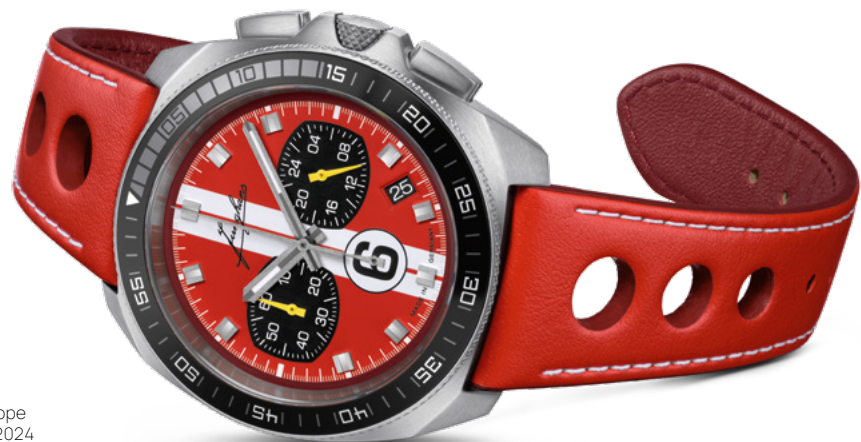
1972 Chronoscope Sports Edition 2024 4114466.00

クラシックなレース競技の雰囲気。1972 Chronoscope Sports Edition 2024のダイヤルは、印象的なダブルストライプ、歴史的なユンハンスのロゴ、そしてスタートナンバーの形をした6の数字が特徴です。このスポーティな時計は各200本限定です。