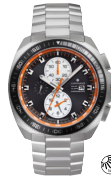
1972 Chronoscope Solar 14/4202.44