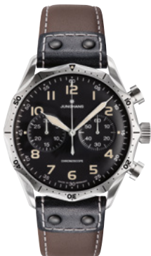
Pilot Chronoscope 27/3591.00