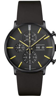
FORM A Chronoscope 27/4473.02