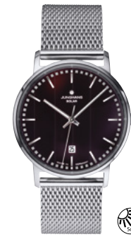
Milano Solar 14/4061.44