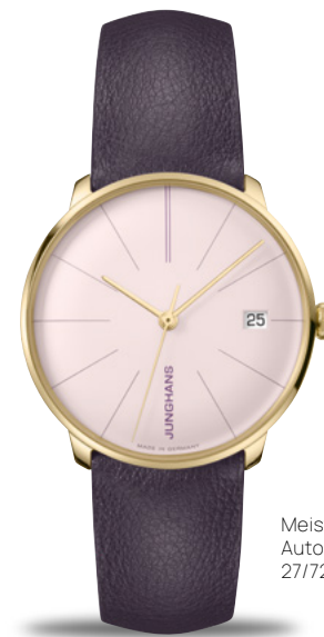
Meister fein Kleine Automatic 27/7232.00