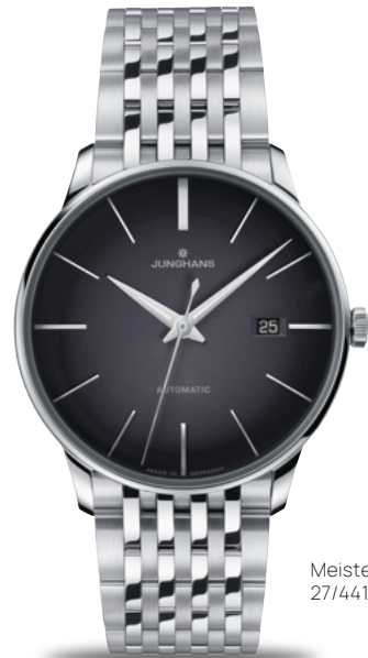
Meister Automatic 27/4417.46