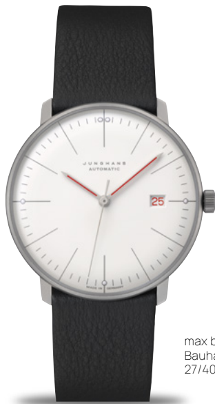
max bill Automatic Bauhaus 2714009.02