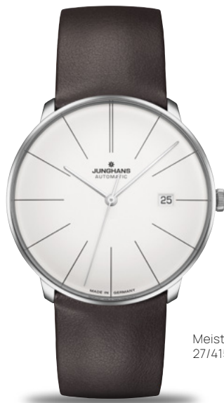
Meister fein Automatic 27/4152.00