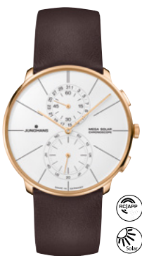
Meister feyn Chronoscope Mega Solar 59/7201.00