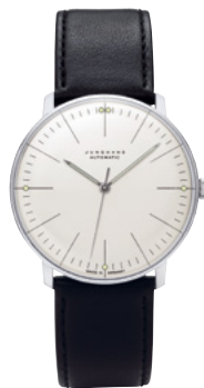
max bill Automatic 27/3501.02