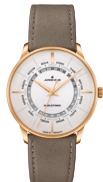
Meister Worldtimer 275012.01