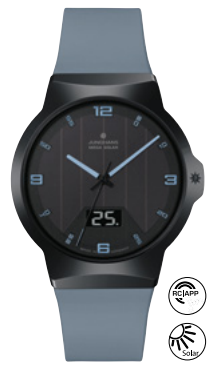
Force Mega Solar 18/1401.00