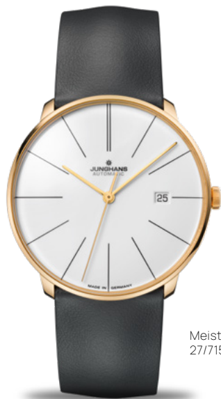
Meister fein Automatic 27/7150.00