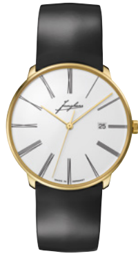
Meister fein Automatic Edition Erhard 27/9301.00