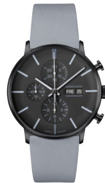
FORM A Chronoscope 27/4371.00