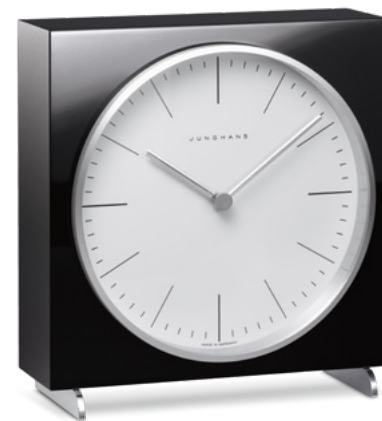
max bill Tischuhr radio-controlled (EU) 383/2202.00 quartz 363/2212.00