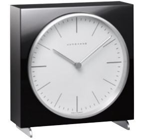
max bill Tischuhr radio-controlled (EU) 383/2202.00 quartz 363/2212.00