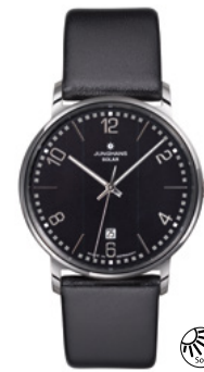
Milano Solar 14/4062.00