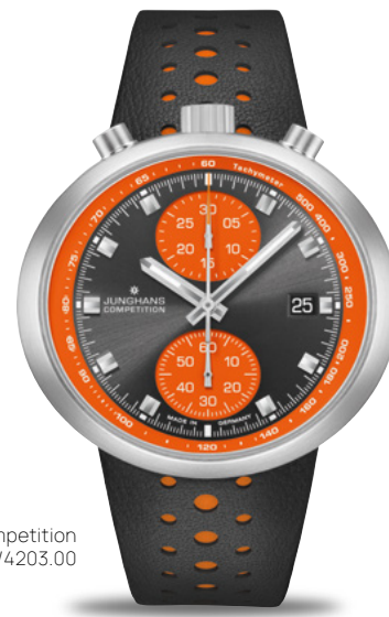
1972 Competition 2714203.00

このロングセラーにインスパイアされたのが1972 Competitionです。ダイナミックな楕円形のケース、ストップウォッチスタイルで上にボタンとクラウンが配置され、アンストライト（無煙炭）のダイヤルとオレンジの積算計およびタキメーター目盛のコントラストがスリリングです。高耐傷性のサファイアクリスタルやネジ込み式クラウンからステンレススチールスクリューによって固定されたストラップにいたるまで、最新の装備です。