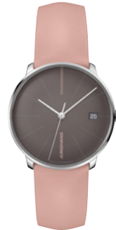
Meister fein Kleine Automatic 27/4231.00