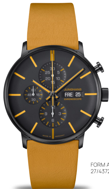
FORM A Chronoscope 2714372.00