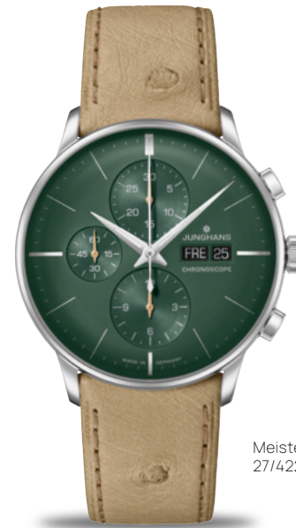
Meister Chronoscope 27/4222.02