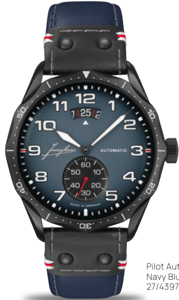
Pilot Automatic Navy Blue 27/4397.00