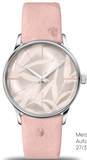
Meister Damen Automatic 2713242.00