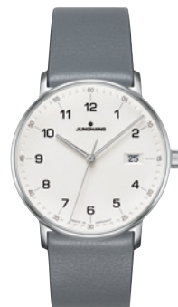
FORM Quarz 41/4885.00