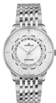
Meister Worldtimer 273011.45