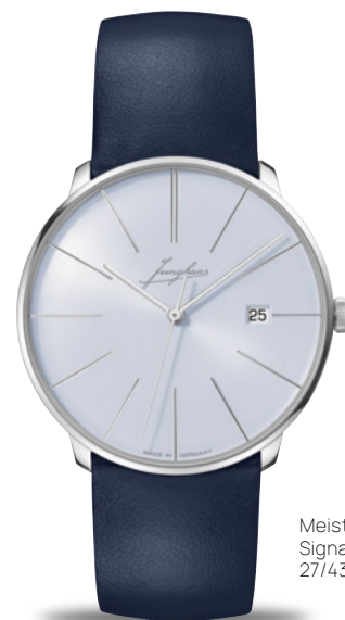
Meister feyn Automatic Signatur 2714359.00

Meister feyn Automatic Signaturは細かい貴重なディテールが魅力です。フラットなケース。反射防止コーティングサファイアクリスタルを用いたドーム型のフロント部分とバック部分。歴史的なユンハンスのロゴ。アワーマーカー用のダイヤモンドカットのラインが付いたダイヤル。特大サイズのシースルーバックを通して、ユンハンス独自開発のツアーームローターの眺めを楽しむことができます。