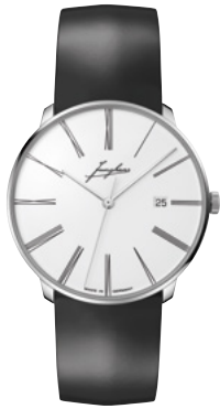
Meister fein Automatic Edition Erhard 27/9300.00