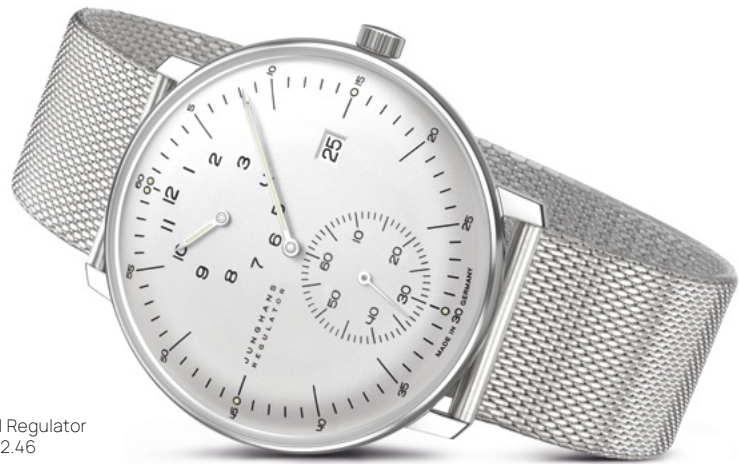
max bill Regulator 2714492.46

max bill Regulator で印象的なのは、時間、分、秒が完全に別表示になっている点です。時間表示を時間、分、秒の三つの基本単位に分けることで、時間を確認する際、そのいずれか一つだけに注目できるようになっています。