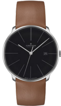
Meister fein Automatic 27/4154.00