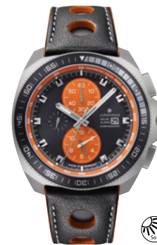
1972 Chronoscope Solar 14/4200.00