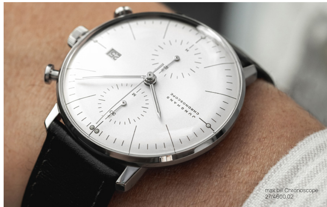
max bill Chronoscope 27/4600.02

ステンレススチールケース | サファイアクリスタル | 防水5気圧 max bill Kleine Automatic : 自動巻ムーブメント J800.1 | ケース 直径34.0 mm max bill Automatic : 自動巻ムーブメント J800.1 | ケース 直径38.0 mm