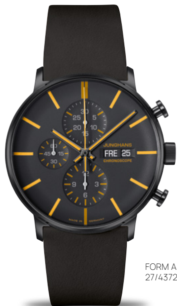
FORM A Chronoscope 2714372.00