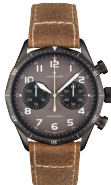
Pilot Chronoscope 27/3794.00