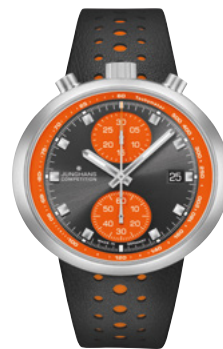
1972 Competition 27/4203.00