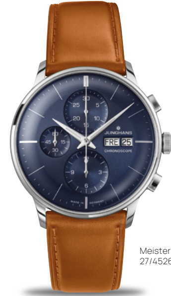
Meister Chronoscope 27/4526.02

自動巻ムーブメント J880.1 | ストップウォッチ機能 | ステンレススチールケース、直径40.7 mm | サファイア クリスタル | シースルーバック | 防水5気圧