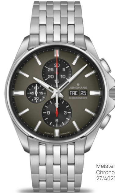
Meister S Chronoscope 2714023.44

重量感があり、ダイナミックな流線形のサイドプロテクション、反射防止コーティングサファイアクリスタルそして20気圧防水などの機能によりスポーティーで男性的そして究極の高耐傷性を確保しています。ステンレススチール プレスレットは、簡単にプレスレットの長さを調整できる微調整機能付きです。