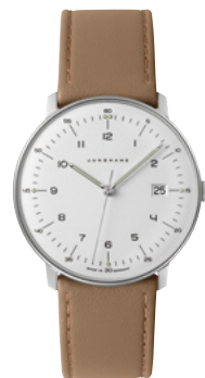
max bill Quarz 41/4562.02