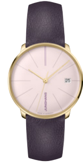
Meister fein Kleine Automatic 27/7232.00