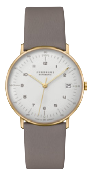
max bill Kleine Automatic 27/7108.02