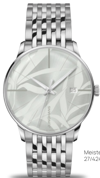
Meister Automatic 2714243.46