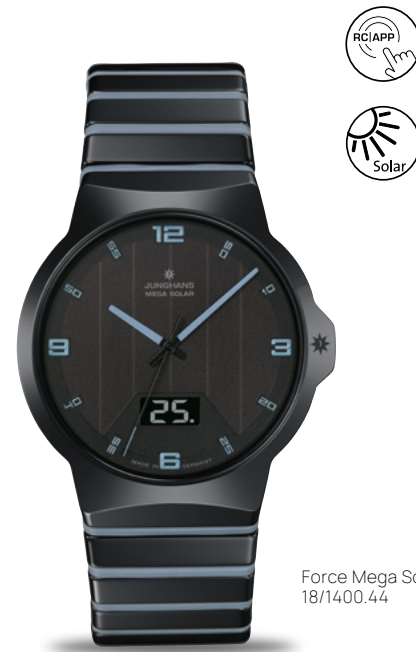
Force Mega Solar 18/1400.44

ユンハンス多周 波電波式ソーラームーブメント J615.84 | パワーリザーブ最大21か月 | セラミックケース 直径40.4 mm | ファイアクリスタル | 5気圧防水