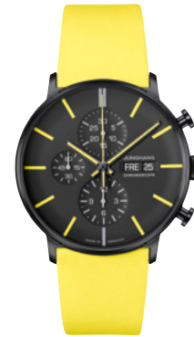
FORM A Chronoscope 27/4473.00