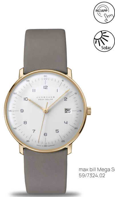
max bill Mega Solar 59/7324.02

デザイナー、マックス・ビルにとっては視覚的な持続性が何よりも重要でした。max bill Mega Solarではそうした持続性をエネルギーの持続性と結び付けています。効率の高いアプリ連動型電波式ソーラームーブメントが太陽の力で駆動します。永久カレンダー、夏時間と冬時間の自動切り替え、そしてタイムゾーンの調整はクラウンまたはJunghansアプリを使って簡単にできるので、今日だけでなく、明日からも快適に使える時計です。