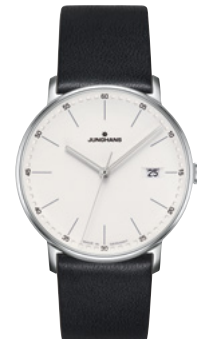
FORM Quarz 41/4884.00