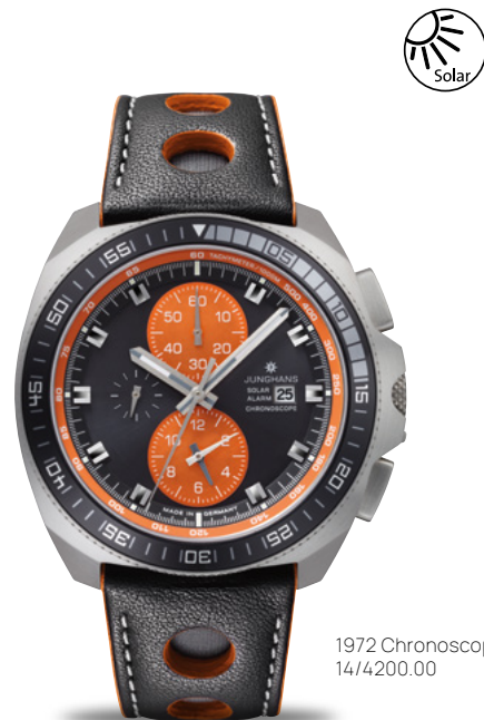
1972 Chronoscope Solar 14/4200.00