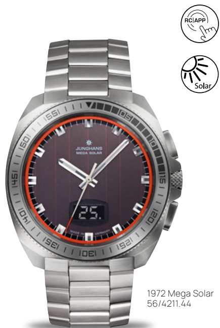
1972 Mega Solar 56/4211.44