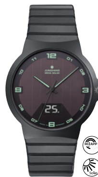
Force Mega Solar 18/1436.44