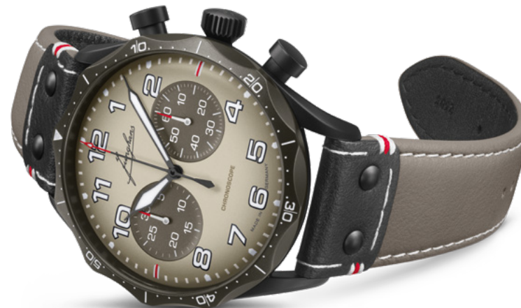
Pilot Chronoscope Desert 27/3398.00