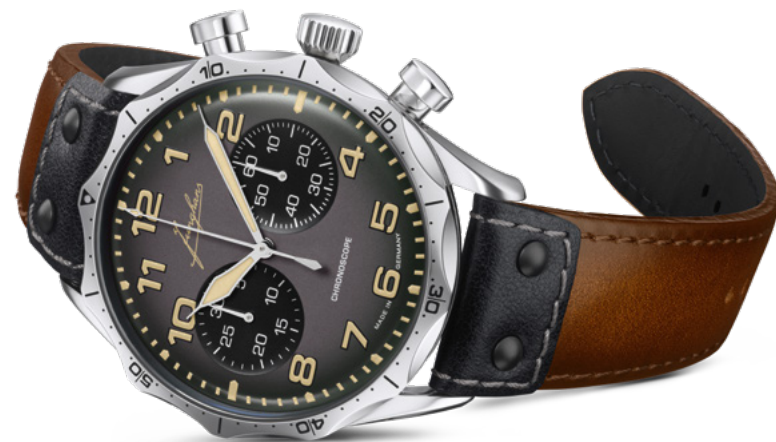
Pilot Chronoscope 27/3493.00