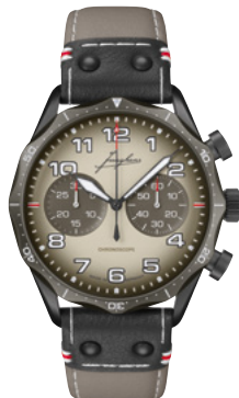
Pilot Chronoscope Desert 27/3398.00