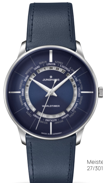
Meister Worldtimer 27/3010.01

PVD加工ステンレススチールのケース | サファイアクリスタル | シースルーバック | 防水5気圧 Meister Chronoscope : 自動巻ムーブメント J880.1 | ストップウォッチ機能 | ケース 直径40.7 mm Meister Handaufzug : 手巻き式ムーブメント J815.1 | ケース 直径37.7 mm