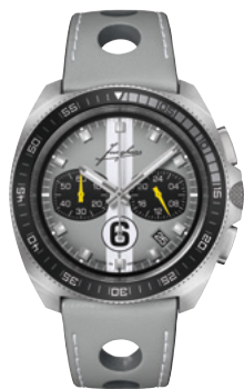
1972 Chronoscope Sports Edition 2024 41/4468.00