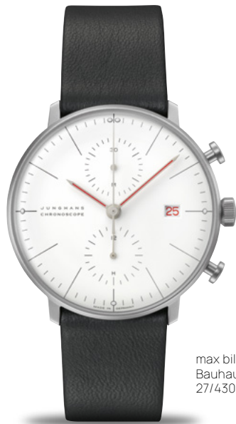
max bill Chronoscope Bauhaus 2714303.02