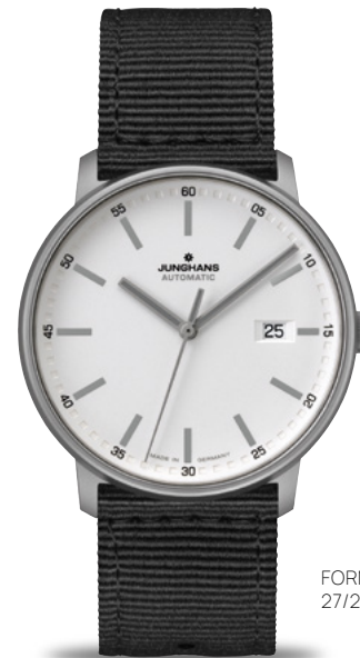
FORM A Titan 27/2000.00

FORM C: クォーツムーブメント J645.85 | ストップウォッチ機能 | ステンレススチールケース 直径40.0 mm | サファイアクリスタル | 5気圧防水 FORM A: 自動巻ムーブメント J800.2 | ステンレススチールケース直径39.3 mm | カラートーンのシースルーバック | サファイアクリスタル | 5気圧防水 FORM A Titan: 自動巻ムーブメント J800.2 | ステンレススチールケース直径40.0 mm | カラートーンのシースルーバック | 自動巻ムーブメント J800.2 | チタンケース 直径39.3 mm | カラートーンのシースルーバック | サファイアクリスタル | 10気圧防水