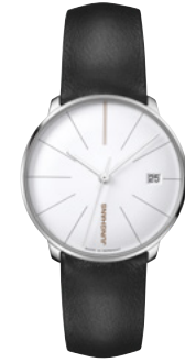
Meister fein Kleine Automatic 27/4230.00