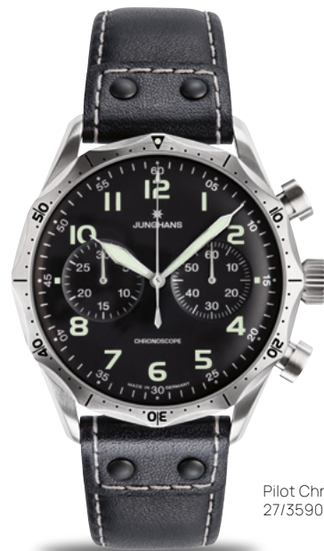
Pilot Chronoscope 27/3590.00

Pilotは、私たちが空の旅にける情熱を物語っています。鮮明に際立つルミナス加工の数字と針が付いたダイヤルは、最高の読みやすさを実現しています。そして人間工学的なデザインのベゼルによりつかみやすさが向上していると同時に独特の外観を生み出しています。