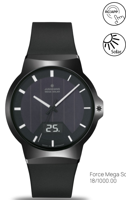
Force Mega Solar 18/1000.00