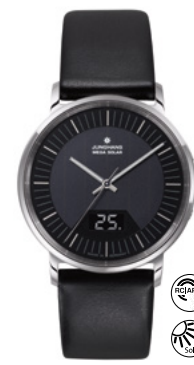
Milano Mega Solar 56/4220.00 incl. milanaise bracelet