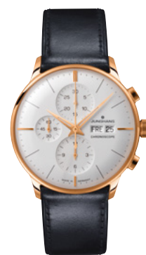
Meister Chronoscope 2717023.02