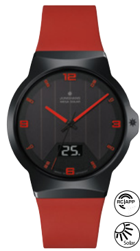
Force Mega Solar 18/1402.00