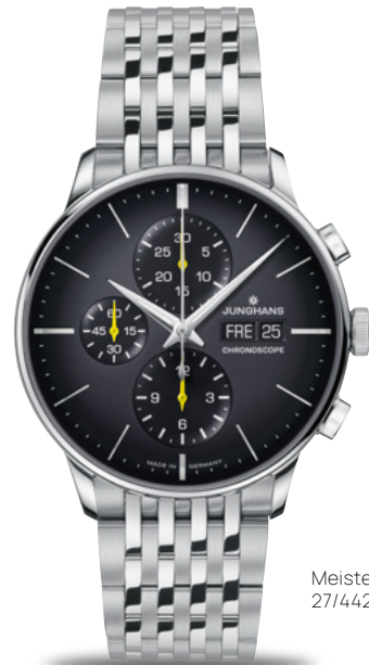
Meister Chronoscope 27/4429.46

その名前が物語っています。Meisterシリーズの時計は、多くのユンハンス・ファンが夢中になる一流の計時を象徴しています。新しいMeister Automaticは、完璧なプロポーションと控えめなエレガントさが印象的で、Meister Chronoscopeにはスポーティなアクセントが加えられています。