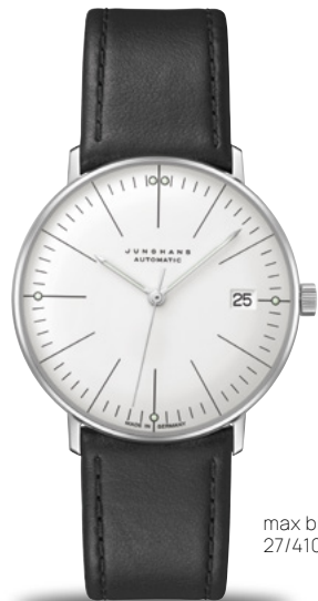
max bill Kleine Automatic 27/4105.02