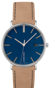
FORM Damen 47/4255.00