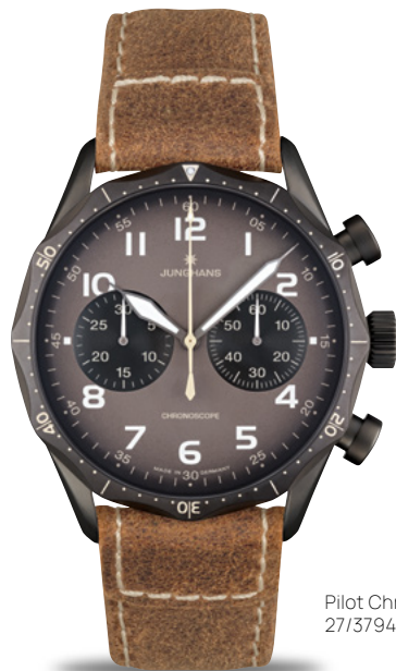
Pilot Chronoscope 27/3794.00