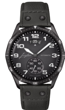
Pilot Automatic 27/4491.00