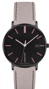
FORM Damen 47/4256.00