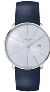
Meister fein Automatic Signatur 27/4359.00