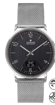
Milano Mega Solar 56/4628.44 incl. leather strap