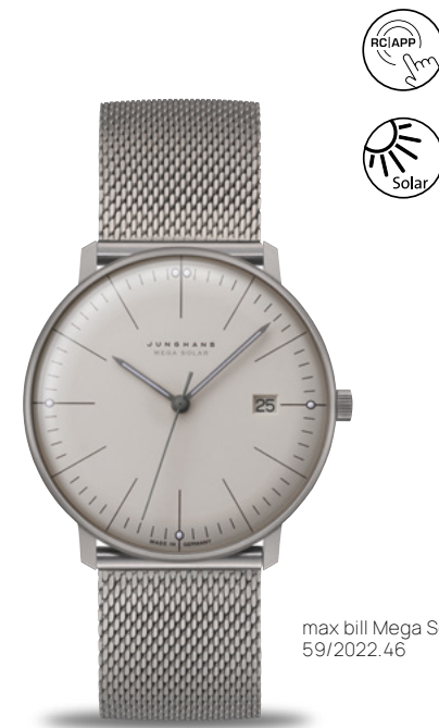
max bill Mega Solar 59/2022.46

ユンハンス連動型電波式ソーラームーブメント J101.85 | スリープモード時の3年間パワーリザーブ | チタンケース 直径38.0 mm | サファイアクリスタル | 5気圧防水