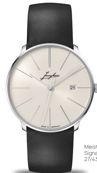
Meister feyn Automatic Signatur 2714355.00