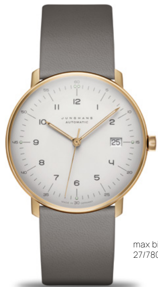
max bill Automatic 27/7806.02