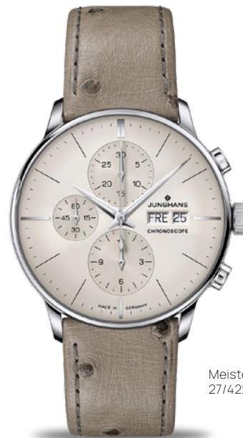
Meister Chronoscope 2714223.02

Junghans Meisterシリーズの時計は、スタイルにこだわる人たちからほぼ一世紀にわたって信頼を受けてきてユンハンスのコレクションの中心をなしてきました。手作業の製造に関する長年の経験に裏打ちされた、数多くのていねいなディテールが魅力です。湾曲したガラス付きの流線形のケース、ドーム型のダイヤル、ボウル形サブダイヤルがエレガントであると同時に立体的な印象も生み出しています。シースルーバックからは装飾された機械式ムーブメントの鼓動が楽しめます。