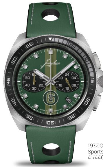
1972 Chronoscope Sports Edition 2024 4114467.00

クラシックなレース競技の雰囲気。1972 Chronoscope Sports Edition 2024のダイヤルは、印象的なダブルストライプ、歴史的なユンハンスのロゴ、そしてスタートナンバーの形をした6の数字が特徴です。このスポーティな時計は各200本限定です。