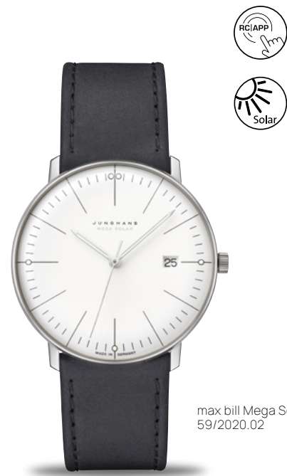
max bill Mega Solar 59/2020.02

耐食性・耐熱性に優れ、驚くほど軽く、肌に優しいチタニウム製のこのmax bill Mega Solarのバージョンはなめし処理された植物性のレザーストラップを使用して、特別に快適な着用感です。