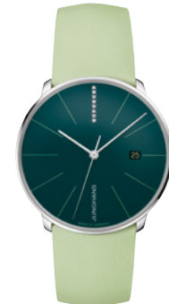
Meister fein Automatic 27/4357.00