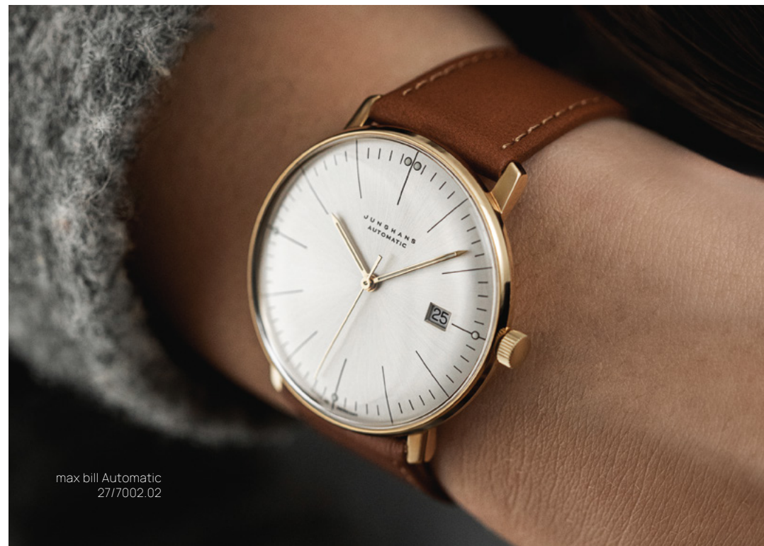
max bill Automatic 27/7002.02

自動巻ムーブメント J800.1 | PVD加工ステンレススチールのケース | サファイアクリスタル | 防水5気圧 max bill Automatic : ケース 直径38.0 mm max bill Kleine Automatic : ケース 直径34.0 mm