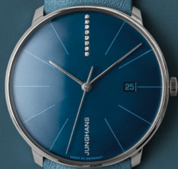
Meister fein Automatic 2714356.00