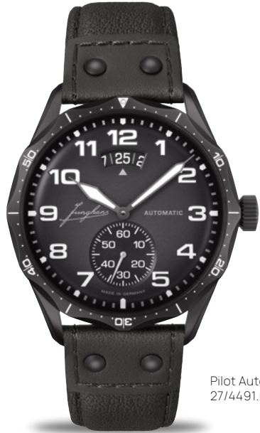
Pilot Automatic 27/4491.00