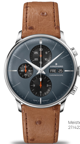
Meister Chronoscope 2714224.02

自動巻ムーブメント J880.1 | ストップウォッチ機能 | ステンレススチールケース、直径40.7 mm | サファイア アイクリスタル | シースルーバック | 防水5気圧