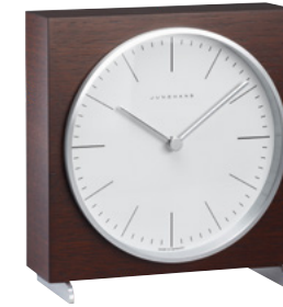
max bill Tischuhr radio-controlled (EU) 383/2201.00 quartz 363/2211.00