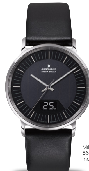
Milano Mega Solar 56/4220.00 incl. milanaise bracelet

太陽の光をあびて: Milano Mega Solar と Milano Solar においてはハイスペックな太陽電池が必要なエネルギーを生み出します。ガラスソーラーダイアルはコストゼロの太陽光を動力源としており、当社の研磨工房やプリント工房にて数多くの作業手順を経て加工されています。