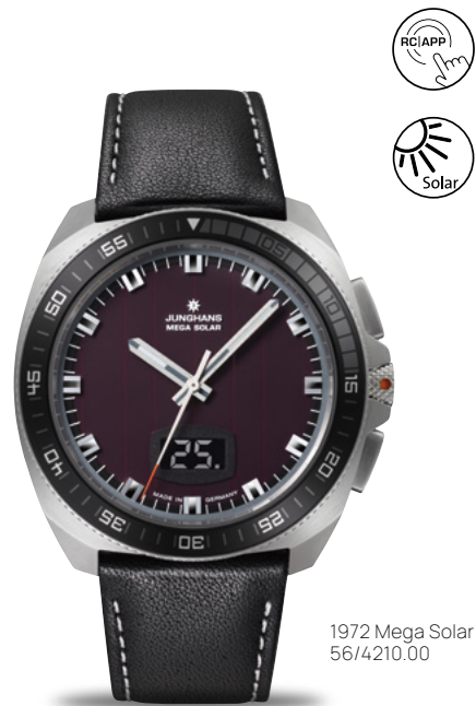
1972 Mega Solar 56/4210.00