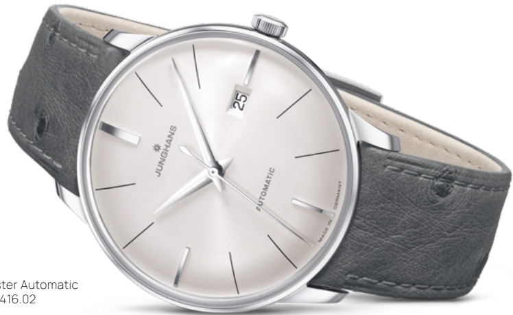
Meister Automatic 27/4416.02