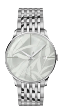
Meister Automatic 2714243.46