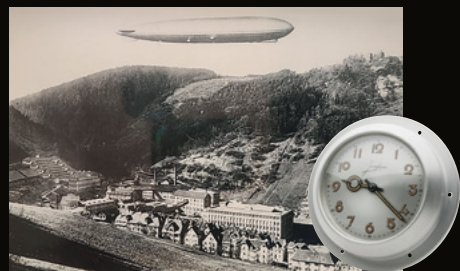
1920年代 シュランベルク上空のツェッペリン、ツェッペリン搭載の機内時計