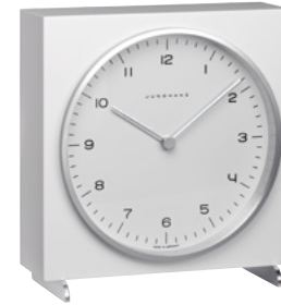
max bill Tischuhr radio-controlled (EU) 383/2200.00 quartz 363/2210.00