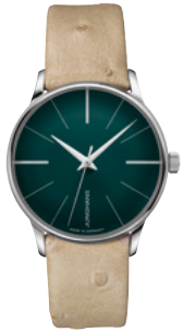
Meister Damen Automatic 27/3343.00