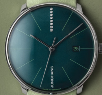
Meister fein Automatic 2714357.00