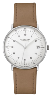
max bill Kleine Automatic 27/4107.02