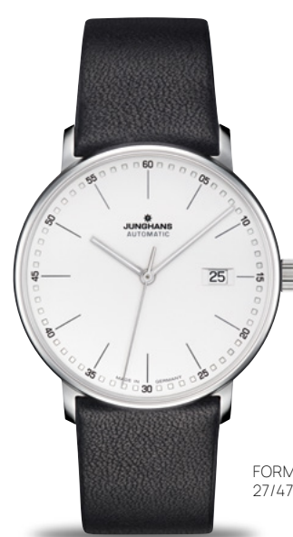
FORM A 27/4730.00

Form follows function: ドイツ式インダストリアルデザインをユニバーサルデザインたらしめた、デザイン至上主義このデザインは、時計シリーズにFormという名が冠された由来です。この名は偶然つけられたものではありません。無駄を徹底して省き、スタイリッシュで機能性に優れているということなのです。