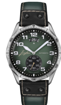
Pilot Automatic 27/4495.00