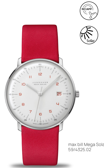
max bill Mega Solar 59/4325.02

Junghans 連動型電波式ソーラームーブメント J101.85 | 最大3年のパワー[リザーブ] | ステンレススチールまたはPVD加工のケース 直径38.0 mm | サファイアクリスタル | モチーフをプリントしたケースバック | 防水5気圧