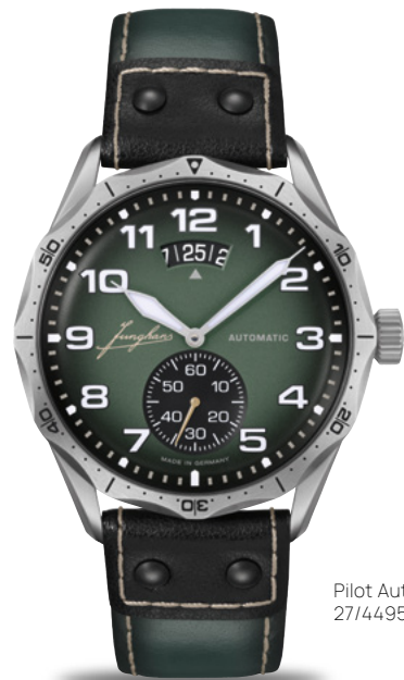
Pilot Automatic 27/4495.00