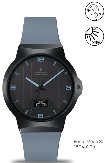
Force Mega Solar 18/1401.00