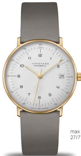
max bill Kleine Automatic 27/7108.02