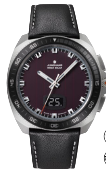
1972 Mega Solar 56/4210.00